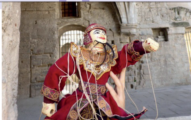
↑ Première journée d'études du groupe de recherche Théâtre et patrimoine « Les Carmes : théâtre et patrimoine à Avignon » (juin 2018)

Le laboratoire ICTT bénéficie d'infrastructures qui lui permettent de développer une recherche novatrice, « la recherche-création ». La thèse « création » s'adresse à des artistes-chercheurs (dramaturges, écrivains, metteurs en scène, etc.) et vise une méthodologie innovante avec une recherche pratique en « création » et une problématisation scientifique autour de leur pratique artistique. Cette approche a été développée au Canada et arrive progressivement en France. Le laboratoire ICTT a saisi l'opportunité puisqu'il travaille sur le théâtre, dans un environnement riche.