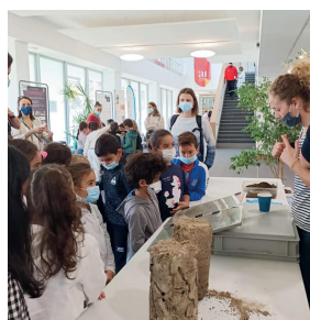
↑ L'équipe des 30 ans de la Fête de la Science en Vaucluse