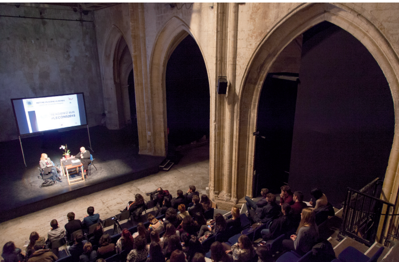
© Université d'Avignon et des Pays de Vaucluse