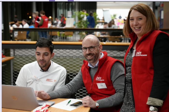
↑ Les 24h pour entreprendre, jeu de création d'entreprise, organisé chaque année par SAFIRE à la bibliothèque universitaire Maurice Agulhon.

La formation des étudiants concerne l'ensemble des grades, de la licence au doctorat. Le Collège des études doctorales s'engage à renforcer les compétences entrepreneuriales des doctorants en proposant une gamme variée de formations. Parmi elles, les cours dispensés couvrent des aspects essentiels tels que les bases de la propriété intellectuelle, l'univers entrepreneurial et le management. Des actions dédiées à la création d'entreprise et à sa mise en pratique viennent compléter ces enseignements, offrant aux doctorants une perspective pratique sur le processus entrepreneurial. Ils peuvent participer à des jeux concours tels que les "24h pour entreprendre", organisé par le SAFIRE, à un Escape Game spécialement conçu pour les doctorants qui est une initiative originale de l'Incubateur Belle de Mai ou assister à des événements comme les "Jeunes docteurs en entreprise", axé sur l'insertion professionnelle des jeunes docteurs et porté par l'école doctorale 536 Agrosciences & sciences. Ce dernier événement a permis aux anciens doctorants de partager leurs expériences professionnelles dans diverses entreprises, avec une session spéciale dédiée à l'entrepreneuriat.